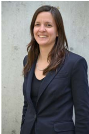
Regula Bircher Tagungsprogramm