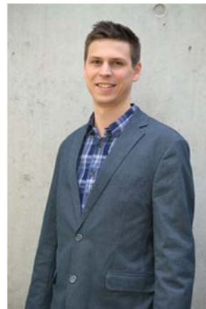
Raphael Kellerhals Homepage/Ticketing